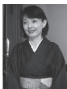
麻生圭子 (あそう・けいこ) — エッセイスト

1937年静岡県生まれ。1959年国学院大学文学部卒。文学博士。専攻は日本民俗学。現在、近畿大学名誉教授、柳田國男記念伊那民俗学研究所所長。特に自然に密着して生きる人々の民俗に着目し「生態民俗学」を提唱、日本人と自然環境の関わりについて独自の考察を深めたことで知られる。著書に『生態民俗学序説』(白水社)、『焼畑民俗文化論』(雄山閣)、『枳と餅』(岩波書店)、『生態と民俗』(講談社学術文庫)など、多数。なお、九州山地の民俗を扱ったものとして、『山地母源論』(岩田書院)がある。