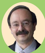
エイモリー・B・ロビンズ氏

環境や農業・食料問題に関する近代の西洋中心的な考え方に警鐘を鳴らし、伝統的スタイルに根ざした価値観や社会構成の重要性など、環境と共生する思想の普及に貢献。