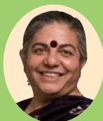
ヴァンダナ・シヴァ氏

社会の急速な近代化の中で、水俣病をテーマに、一貫して自然と共生する人間のあり方を問いつける文学作品を発表し、環境と共生する思想の普及に貢献。