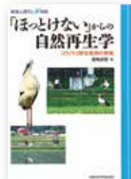
地球研和文学術叢書