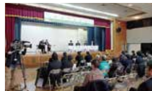
地域連携セミナー