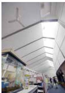
プロジェクト研究室