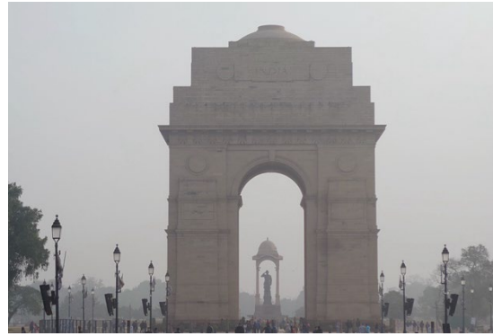
写真2:PM 2.5 の高濃度時におけるデリー首都圏での視界不良の様子 (2023年1月14日撮影、プラビル・K・パトラ)