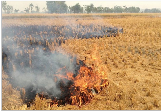
写真1:パンジャブ地方の稲わら焼きの例 (2018年11月4日撮影、林田佐智子)