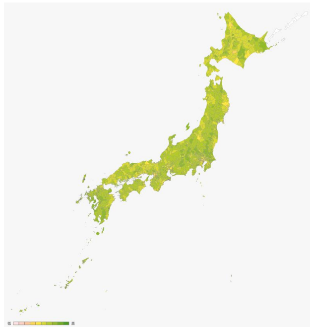
図2 土地利用総合評価の日本全国地図

【取材申し込み及び問合せ先】 総合地球環境学研究所(地球研) 広報室 岡田、中大路 Email: kikaku[at]chikyu.ac.jp *[at]を@に変更して下さい。 Tel: 075-707-2450/070-2179-2130