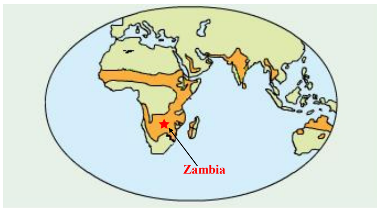
図1. 半乾燥熱帯と調査対象地域