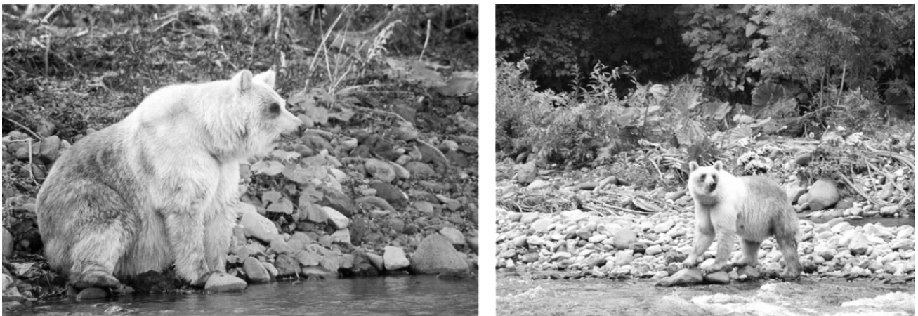
図1：国後島の白いヒグマの写真（Sato et al. 2011 より引用）

ただし、北アメリカでは択捉島と同程度かそれ以上にサケを多く利用するヒグマの個体群が複数存在します。それにも関わらず、これらの個体群では白い体色のヒグマは確認されていません。従って、白い体色のヒグマが維持される要因はサケの利用のみでは説明することはできません。白いヒグマの謎を完全に解明するためには、ヒグマの捕食者の分布や遺伝的要因など、様々な要素を考慮する必要があります。