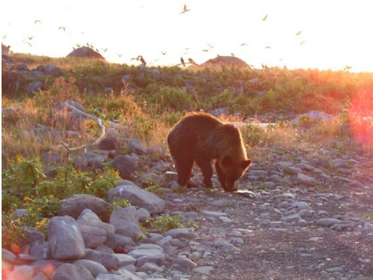
図1：サケを食べるヒグマ

分析の結果、ヒグマの食性は時代経過に伴って肉食傾向から草食傾向に大きく変化していたことが明らかになりました(図2)。道東地域ではサケの利用割合が19% (Period 1)から8% (Period 3)まで減少し、陸上動物(エゾシカや昆虫)の利用が64%から8%にまで減少していました。また、道南地域では陸上動物の利用割合が56% (Period 1)から5% (Period 3)まで減少していました。窒素同位体比値の時間的変化から、この大規模な食性の変化は、概ねここ200年の間に急激に進行したことが示されました(図3)。約200年前というのは、明治政府による開発が本格化した時期と一致しています。