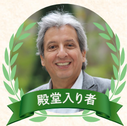
マヌエル・プルガル・ビダル氏 (1962年生 ベルギー共和国) WWF気候エネルギー リーダー 元ベルギー環境大臣 COP20議長

国立環境研究所「地球温暖化対策研究チーム」のアドバイザーを務め、WWFジャパンと「脱炭素社会へ向けた2050年エネルギーシナリオ」の作成を行うなど、日本における再生可能エネルギーの普及促進に貢献。