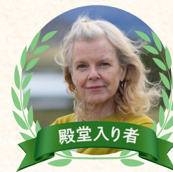
クリス・トンプキンス氏 (1950年生 アメリカ合衆国) 元パタゴニアCEO

COP20の議長として、国際交渉の場に国家以外の主体(ノンステートアクター)の参画を促し、その後の環境保全に関する国際交渉の進展に貢献。