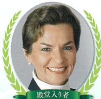
殿堂入り者 クリスティアナ・フィゲレス氏

外交官／前国連気候変動枠組条約事務局長 パリ協定の採択に尽力し、地球環境保全に関する世界的制度の成立や合意形成に貢献