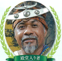
殿堂入り者 ～10周年記念特別賞～ エゴ・レモス氏

宗教学者 環境に関する宗教学的視点からの研究・啓蒙により、環境と共生する思想の普及に貢献