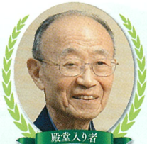
殿堂入り者 山折 哲雄氏

外交官／前国連気候変動枠組条約事務局長 パリ協定の採択に尽力し、地球環境保全に関する世界的制度の成立や合意形成に貢献