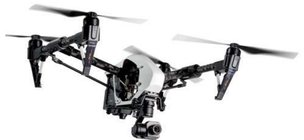
サーマルカメラ搭載のドローン