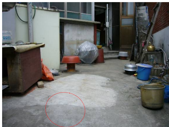
江北区の民家の井戸跡（点線）