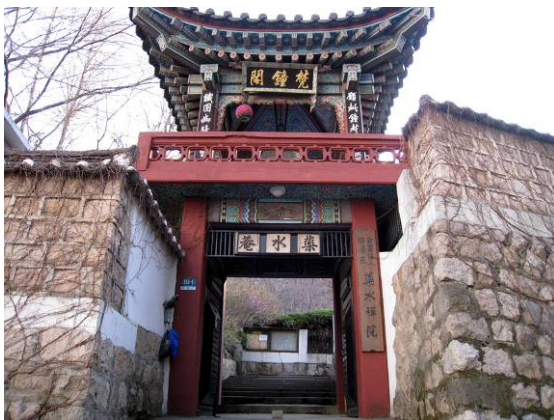
銅雀区にある薬水庵