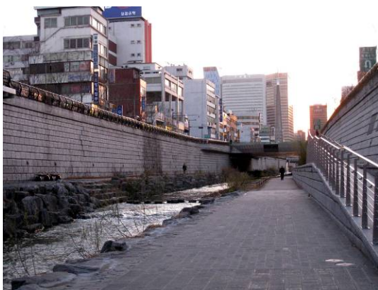
清溪川の冬季風景（乙支路3街付近）