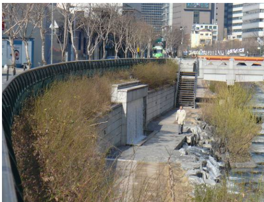
清溪川旧河道（暗渠河道）の吐出口