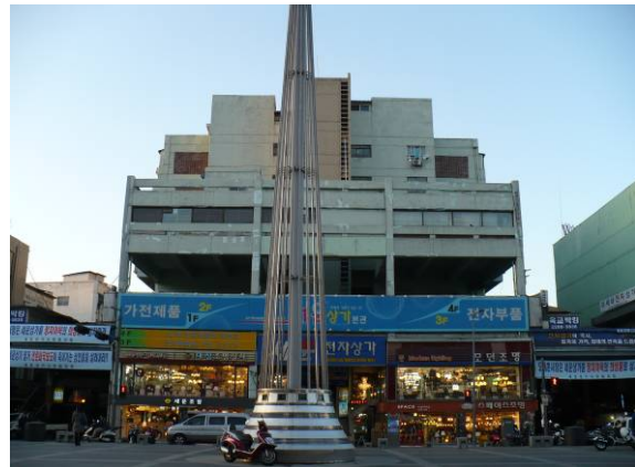
清溪川沿いの世運街（再開発予定地）