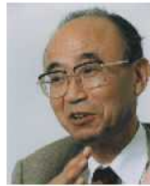
山折 哲雄氏 宗教学者

専門は環境経済学、財政学。開発が保全が、環境が成長かという二者択一的対立概念を越えた理論と政策、とりわけ持続可能な発展を実現する社会経済システムのあり方を探求。著書：『環境と経済を考える』（岩波書店）、『環境経済学への招待』（丸善ライブラリー）など