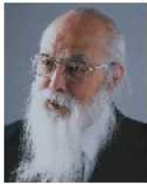
宇沢 弘文氏 経済学者 日本学士院会員 東京大学名誉教授

シカゴ大学教授、東京大学教授などを経て、現在、同志社大学社会的共通資本研究センター長、東京大学名誉教授、日本学士院会員。1983年文化功労者、1997年文化勲章受賞。著書：『経済学の考え方』（岩波書店）、『ウェブレン』（岩波書店）、『経済学と人間の心』（東洋経済新報社）、『宇沢弘文著作集・新しい経済学を求めて（全12巻）』（岩波書店）ほか多数