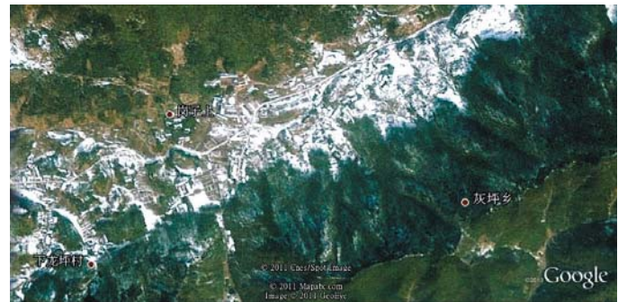
Google Earth からみた灰坪郷 (白い斑は石灰石鉱山と自然的に露出した石灰石である)

近年、観光業が後進地域開発の常套手段になっている。滬杭鉄道・浙贛鉄道が高速化され、杭新景（杭州—新安江—景德鎮）高速道路における衢州区間が竣工されれば、衢州と上海・杭州間の移動時間が4時間ぐらいになる。これに刺激され、地方政府は観光業を核として、竹やお茶などの観光物産のマーケットの開拓も狙いつつ、環境を保全しながら灰坪郷を開発しようとしている。