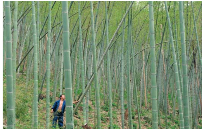
右上：竹を伐る住民（竹に書かれた文字は所有者の名前） 右下：2010年夏の洪水で破壊された自動車道