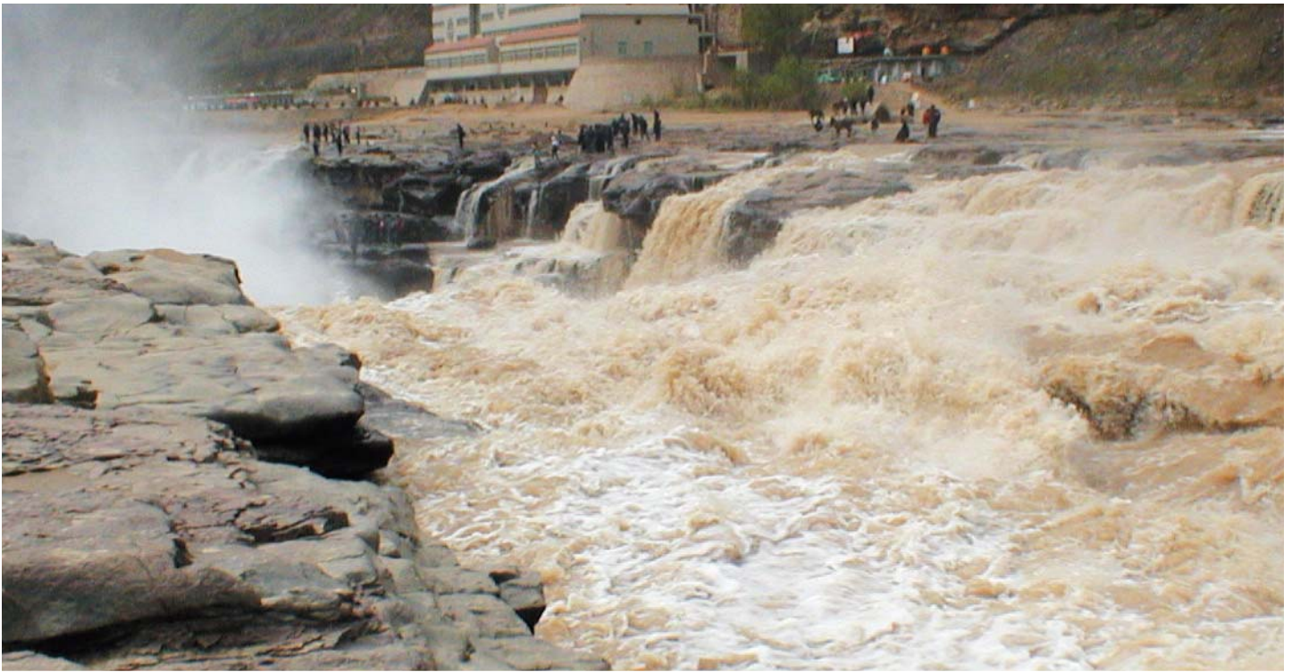
壺口瀑布は黄河の中流域、陝西省と山西省の境に位置する。古代の地理書『水経注』に記載された場所よりも、5 km 上流に移ったという。それは 1500 年にわたって河床を浸食した黄河の変遷の履歴である。陝西省延安市宜川県にて。2002 年 5 月