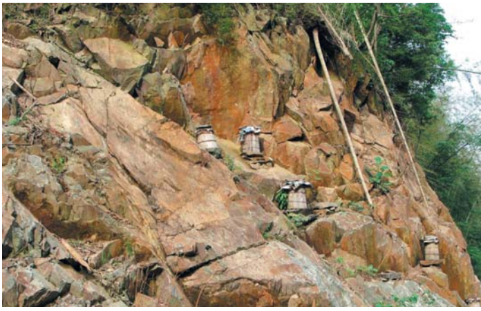
左上：山の斜面に置かれた天然蜂蜜採取用の巣箱 左下：サツマイモが石灰山（手前側）に植えられている