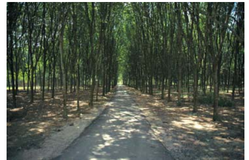
Monoculture rubber plantation