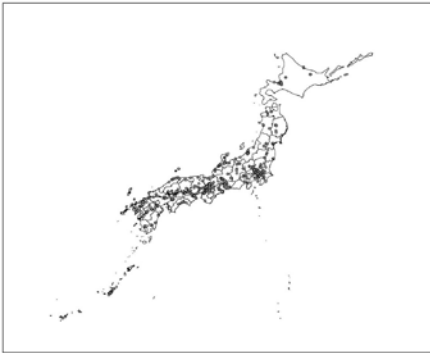
図1：髪の毛を提供していただいた方の居住地の地図

東京大学総合研究博物館 The University Museum, The University of Tokyo